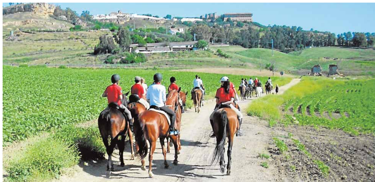
Los participantes tendrán la misma visión de Carmona que apreció Julio César al llegar a la ciudad

Esta jornada ecuestre servirá además de cierra a las actividades del Club Caballista de Carmona que a lo largo del año contempla entre sus acciones una serie de rutas a caballo. Las inscripciones pueden hacerse hasta media hora antes del inicio de la ruta que tendrá lugar en el Manantial de Brenes a las 9:30 de la mañana.