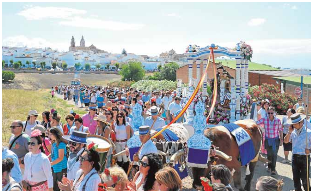
Los fontaniegos acompañan la carreta de María Auxiliadora en su camino hacia la ermita

tiva «Yo compro en Fuentes» impulsada por el Ayuntamiento para apoyar al comercio local. Se trata de la tercera edición de esta campaña en la que han participado hasta el momento 67 establecimientos comerciales y ocho bares y restaurantes.