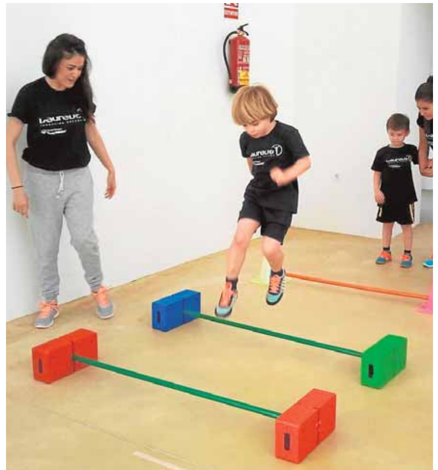
Los pequeños realizan actividades sencillas con múltiples beneficios A.L.

Gran implicación Técnicos, voluntarios y familiares asisten a una decena de niños de entre dos y ocho años