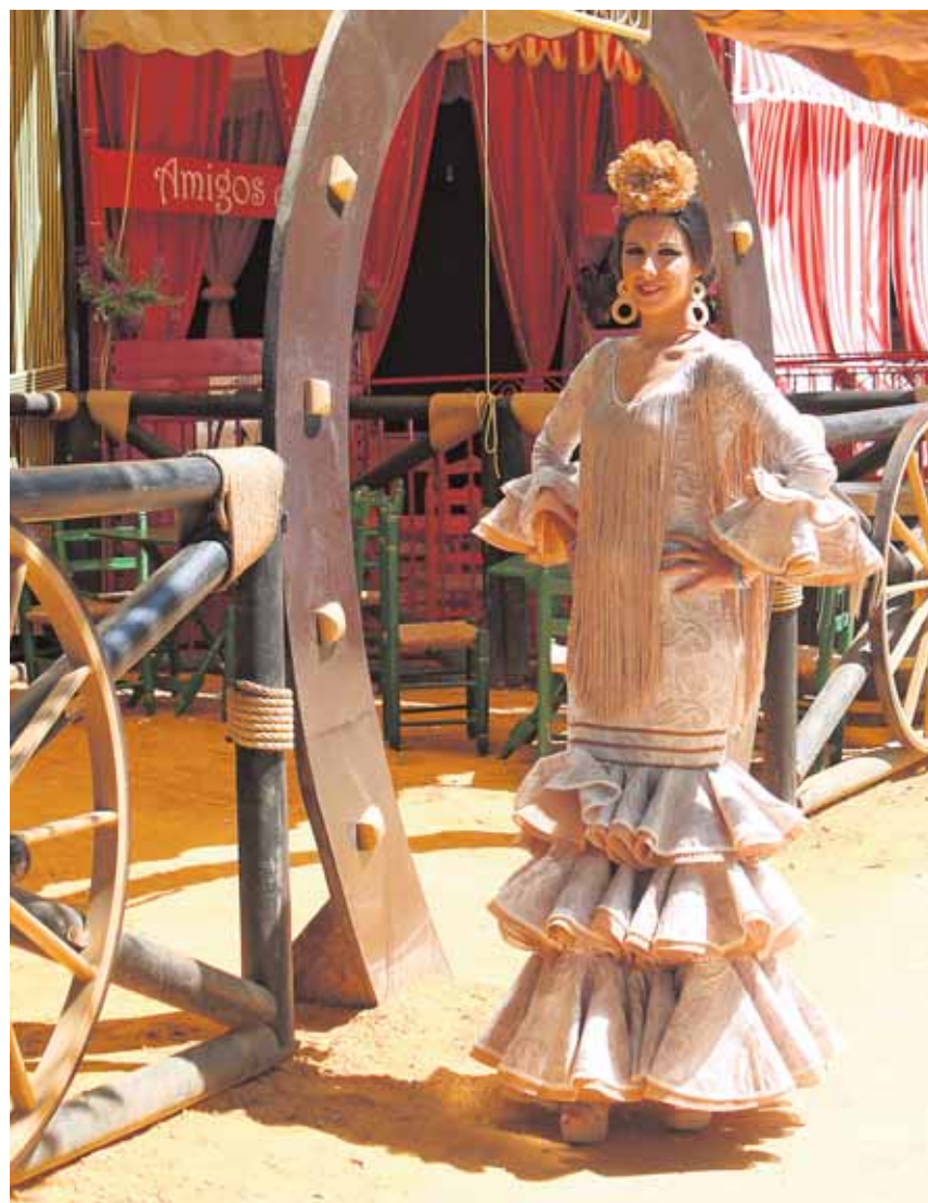
Una joven ferianta en la puerta de una caseta típica de Lora