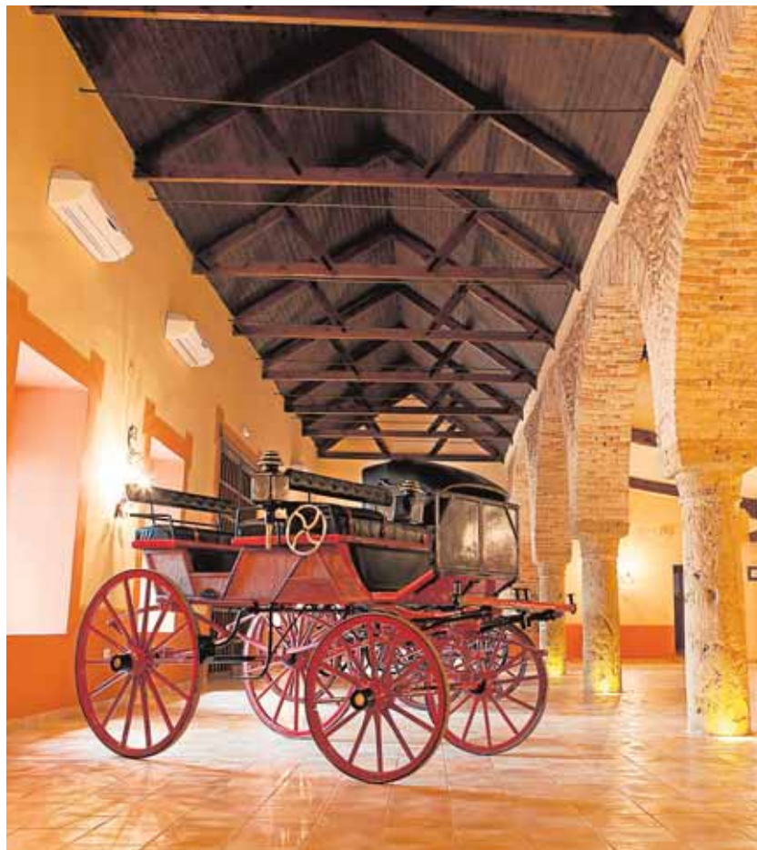
La nave albergaba en sus orígenes una extensa bodega

Además, está catalogada con un nivel de protección B, ya que conserva elementos de gran valor arquitectónico, artístico e histórico; como por ejemplo sus columnas acaracoladas de piedra de albero, las columnas de los arcos, o los imponentes portones de madera que encierran siglos de historia. Sin duda, el excelente estado de Los Frailes es un caso paradigmático de la viabilidad de la conservación del patrimonio, algo que, no obstante, no exime de responsabilidad a las autoridades competentes del estado ruinoso de varias de estas haciendas.