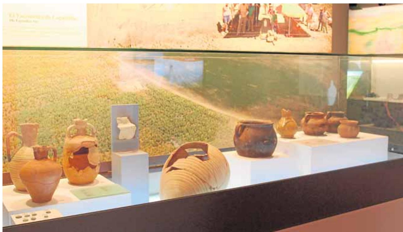
Algunos de los restos encontrados durante las excavaciones realizadas cerca de la planta

del tráfico por parte de las policías locales de Espartinas y Gines está dando resultados favorables. Según aseguran los vecinos que habitualmente utilizan esa vía para ir a trabajar, «supone de un ahorro de veinte minutos». D.C.