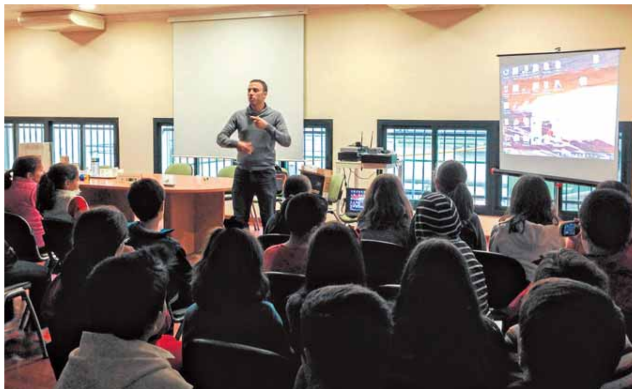
Los alumnos de la Escuela de Aceite Junior asisten a unas de las clases sobre la elaboración del aceite

La iniciativa está abierta a centros de todos los municipios que estén interesados.