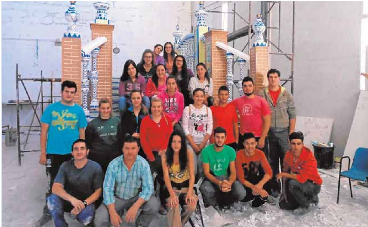
Los alumnos del taller de recuperación de tradiciones, junto a una de las carrozas que desfilará el sábado