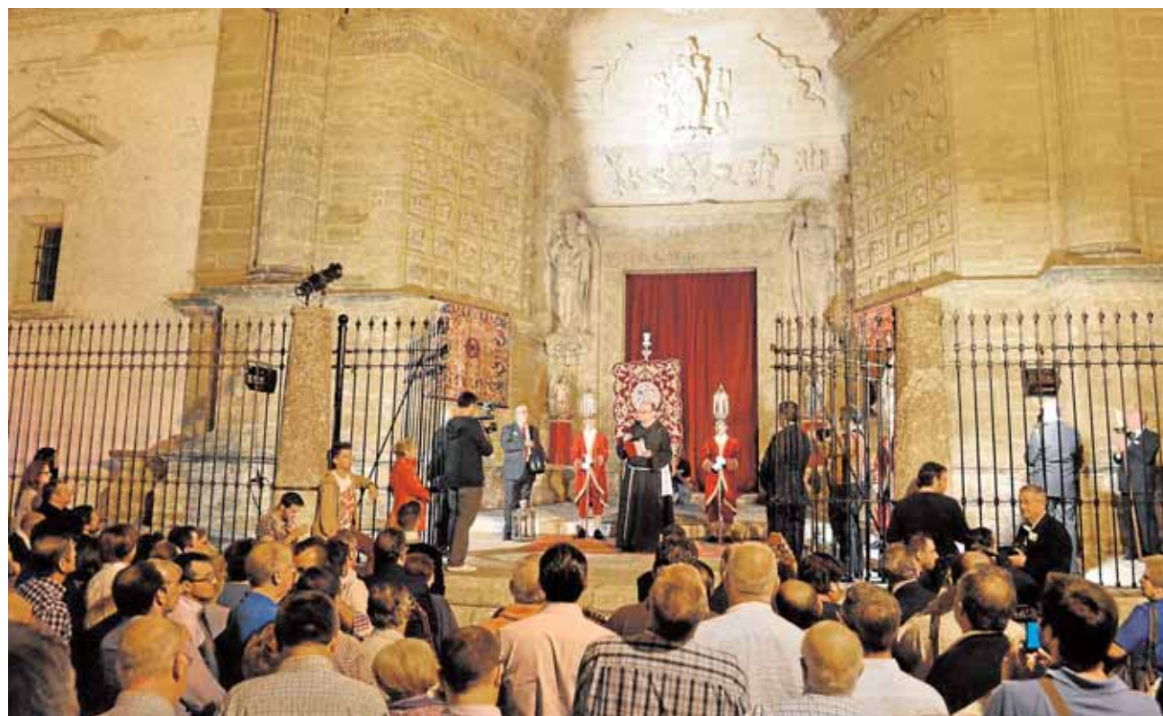
Uno de los actos celebrados en conmemoración del 300 aniversario de la hermandad utrerana de La Trinidad A.F.

Esta herramienta digital se suma a la aplicación para móviles eLebrija y al portal de transparencia de la página web del ayuntamiento.