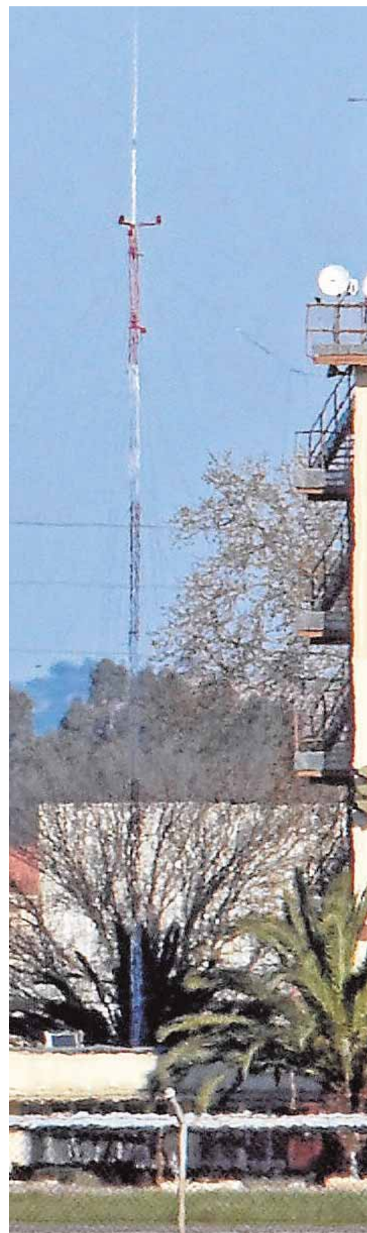
La Base de Morón recibirá este domingo a su...