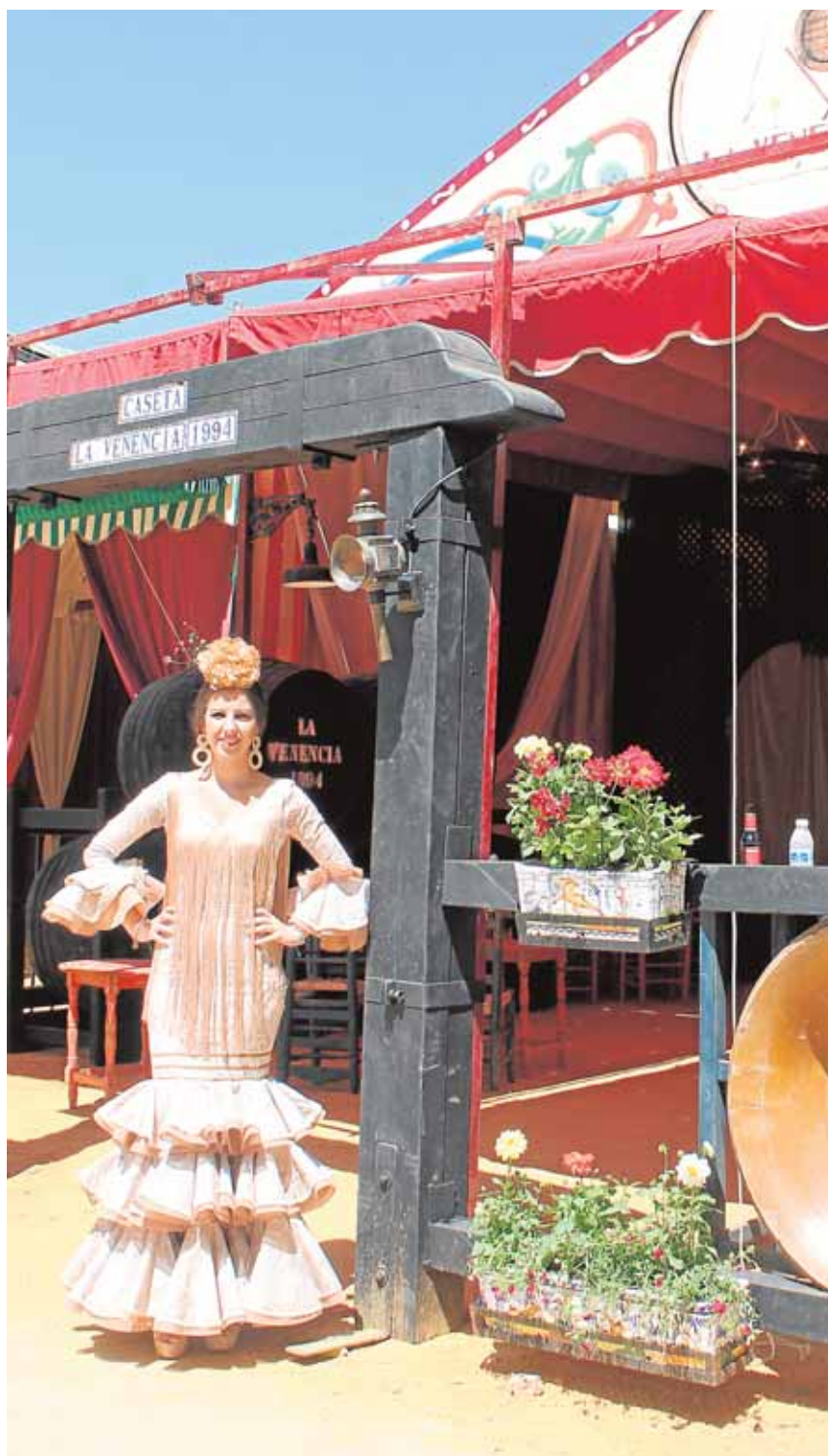
Una joven ferianta, delante de una de las casetas del recinto ferial

Nació en el siglo XIX como feria ganadera y comercial y abandonó ese carácter a mediados del siglo XX